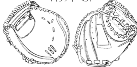
ファーストミット